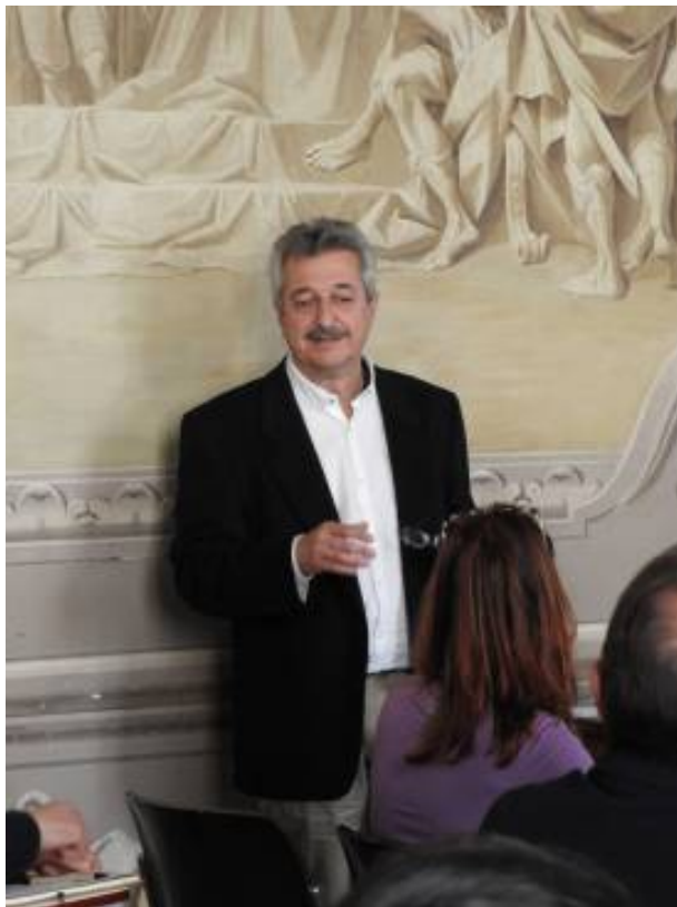
La sala durante lo svolgimento dei lavori